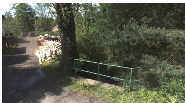
Propustek (pohled po vodě)