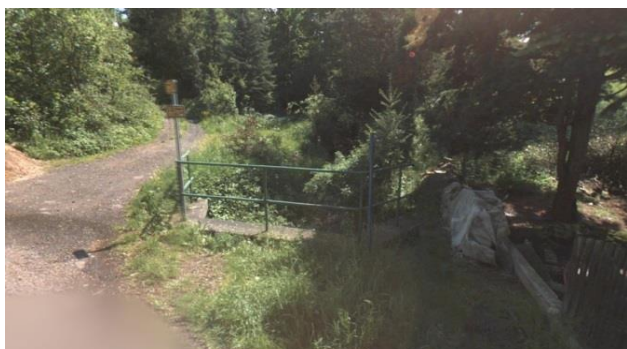
Propustek (pohled proti vodě)

Ohrožení zvýšenými průtoky z extravilánu.